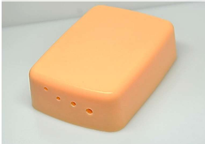
エコー下穿刺トレーニングモデル AKS-AS1